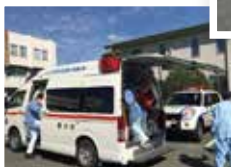
ドクターカーと救急車が合流する様子