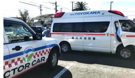
▲救急車とドッキング