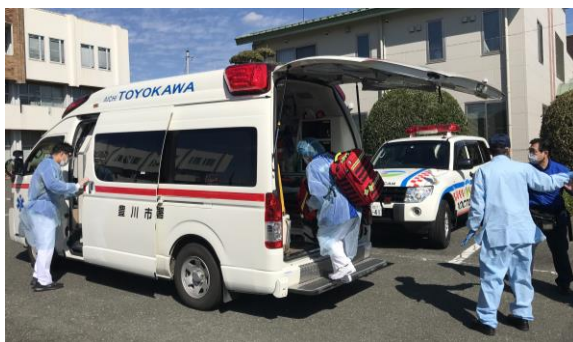
◀車内で気管挿管を実施