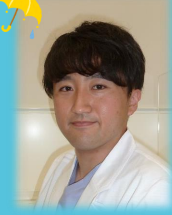
たかす そういちろう 高須 宗一郎