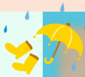
すずき かいだ 鈴木 海太